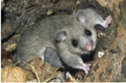
Een huis op de Franse campagne: pas toujours si rigolo !