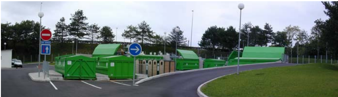
Een wanhopige vuilnisambtenaar.

Sinds een paar jaar is er hier in de buurt een milieustraat, “la déchetterie”. Een goed initiatief, want een hoop grof afval (koelkasten, wasmachines, soms zelfs auto’s) wordt gewoon in de natuur gedumpt. Nu heb je “une carte d’accès” nodig om er afval te mogen brengen. Deze kun je afhalen bij “la mairie” in je gemeente. Tot nu toe lukt het de ambtenaren echter niet om voor ons ook zo’n kaartje te maken, terwijl we keurig onze afvalstoffenheffing betalen. Dus ga ik keer op keer zonder zo’n pasje naar “la déchetterie” en elke keer leg ik dan weer uit aan de betreffende medewerker dat ik nog